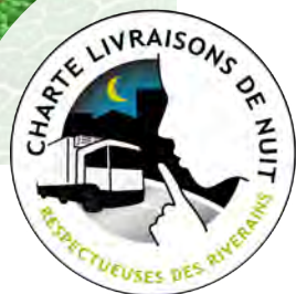
label des sites

L'association CERTIBRUIT® associe tous les intervenants concernés par la labellisation pour assurer la gouvernance de la charte avec les enseignes et commerces vertueux qui souhaitent obtenir le label «livraisons de nuit respectueuses des riverains et de l'environnement».